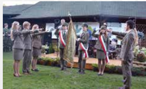
Ślubowanie na Sztandar Szkoły 2018