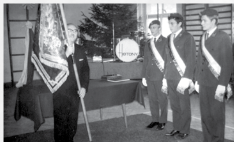
Przekazanie nowego sztandaru szkoły