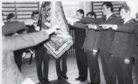
Ślubowanie na Sztandar Szkoły 1968

27 września 2018 r. był szczególnym Dniem Patrona w życiu naszej Szkoły, gdyż dokładnie 50 lat temu nadano Jej imię. Wtedy też Szkoła otrzymała nowy sztandar, na który w 1968 r. uczniowie Technikum Leśnego złożyli ślubowanie po raz pierwszy i ta tradycja podtrzymywana jest do dziś.