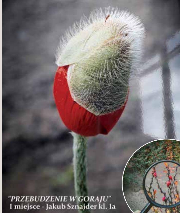
"PRZEBUDZENIE W GORAJU" I miejsce - Jakub Sznajder kl. Ia